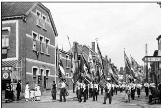
Optocht van de Kajotters op de hoek van de Kerkstraat met de Spoorwegstraat.

Nieuwstraat, Heuvelplein, Nieuwstraat en opnieuw Stationsstraat. “Thans groeit de feeststemming naar het hoogtepunt! De talrijk breed-uitwaaiende Kajottersvlaggen brengen kleur aan de straten en deelen de feestjubel mee aan de vele nieuwsgierigen en belangstellenden. Banjo’s en luid-opklinkende jongensstemmen vullen de lucht met gezang en muziek.” Veel Kajotters droegen een soort van uniform: een lange broek, een wit hemd, een stropdas en een embleem op de linkerborst.