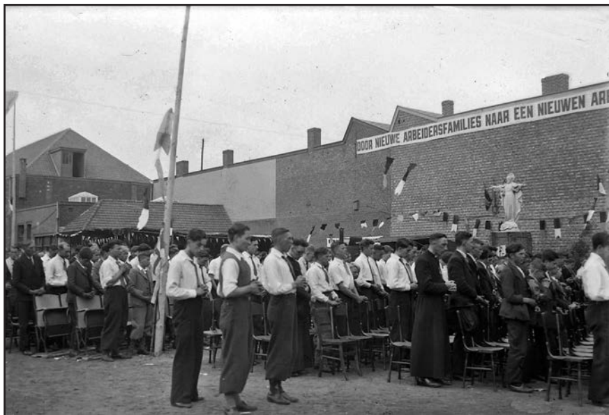
Tijdens de feestvergadering werd er gebeden.