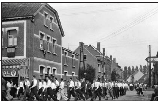
De optocht door Essen telde veel deelnemers.