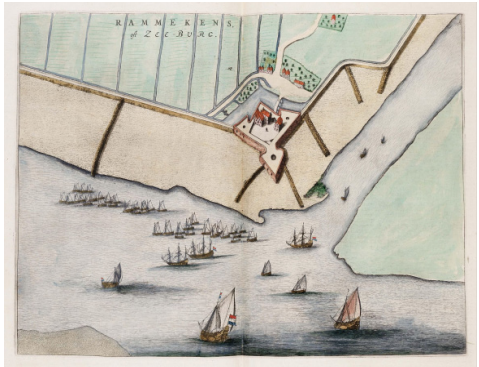
Afbeelding 1: Fort Rammekens. Door Joan Blaeu -Atlas van Loon, Scheepvaartmuseum Amsterdam, https://commons.wikimedia.org/w/index.php?curid=4997993

verder, op moment van schrijven, niets bekend is. Onlangs vonden we de volgende aanvullingen op de jongste generatie. Het echtpaar Nuijts/ Hoogeloon maakte een mutueel testament dat door notaris J. Dons 2 op 28 januari 1687 om 8 uur 's avonds gepaseerd wordt ten huize van de testateurs te Roosendaal. Het gezin Nuijts Hoogeloon is omstreeks 1689 naar Bergen op Zoom verhuisd, aldaar werden nog drie kinderen geboren, namelijk opnieuw een Nicolaas (*1690) en daarna een Cornelis (*1692) en een Hendrik